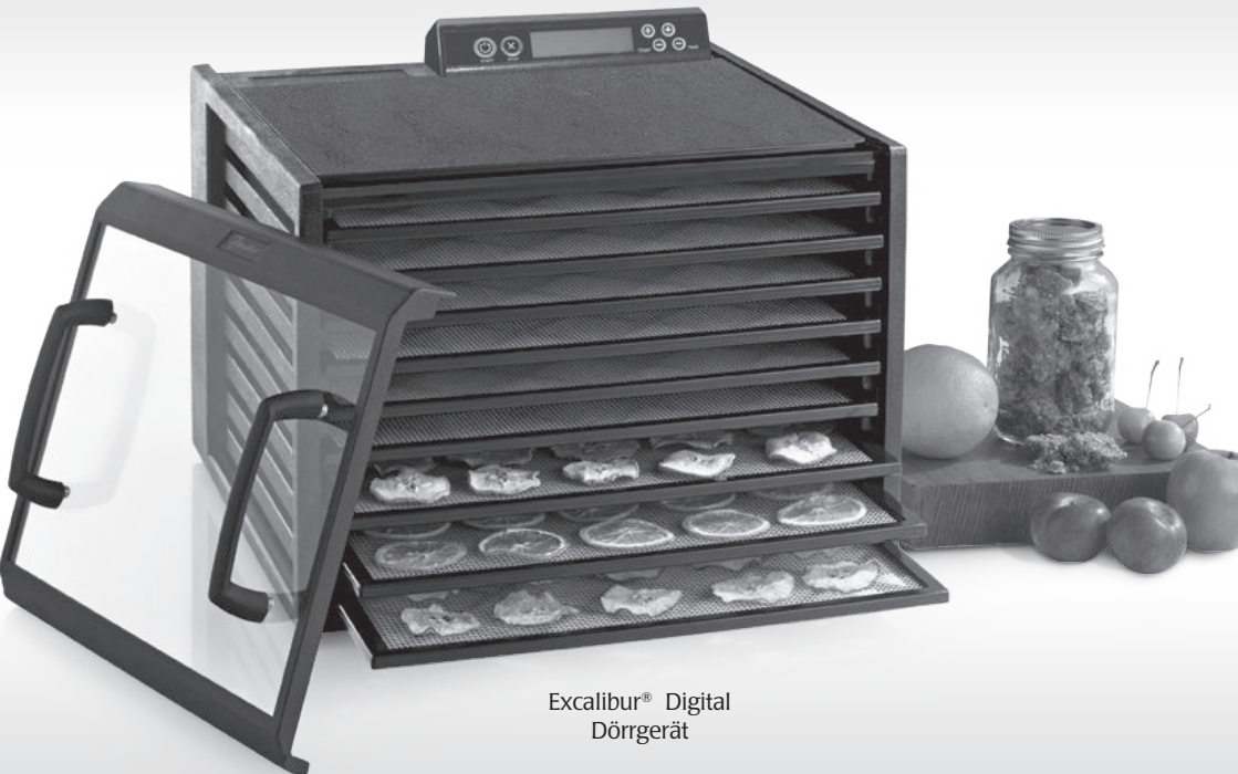
Excalibur® Digital Dörrgerät