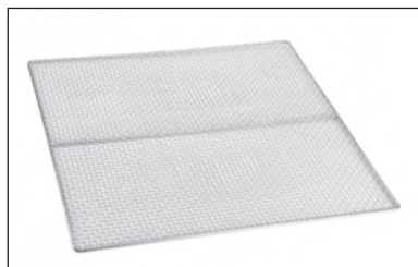
Edelstahleinschub (Artikelnummer 56324)